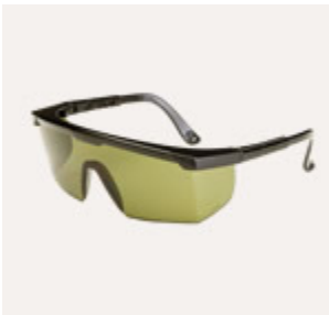
Gafas de protecció l aser