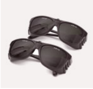
Gafas de protecció l aser Eme