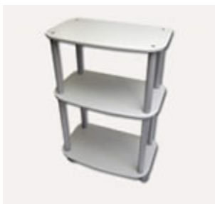
Carro con 3 estantes