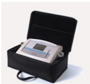
Maleta vacía en TNT para transporte